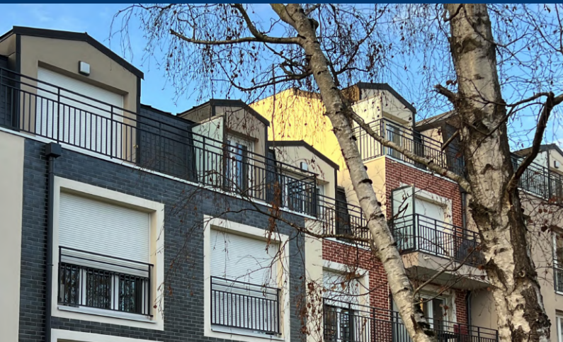
70 logements à Champlan Maîtrise d'ouvrage : LIVINX 5 705 000 € HT 3260 m 2 SDP 2025

Spécialisés dans la création de projets résidentiels adaptés aux maîtrises d'ouvrages privées, nous optimisons l'utilisation de l'espace, en intégrant les besoins des façons d'habiter actuelles (Co-living, Programmes partagés, résidences autonomes / étudiantes), tout en respectant les contraintes réglementaires. Notre approche créative et pragmatique permet de réaliser des projets aux coûts maîtrisés, tout en offrant des espaces de vie de qualité supérieure.