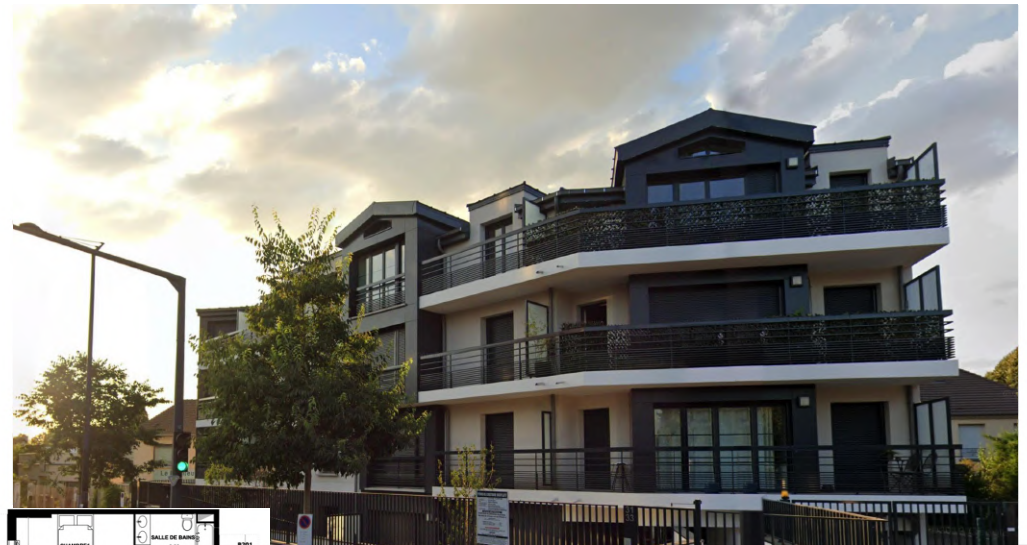
31 logements 23,29, avenue Léon Jouhaux, 92002 ANTONY Maîtrise d'ouvrage : PICHET 3 600 000 € HT 2153 m 2 SDP 2016-2018 MISSION DE BASE