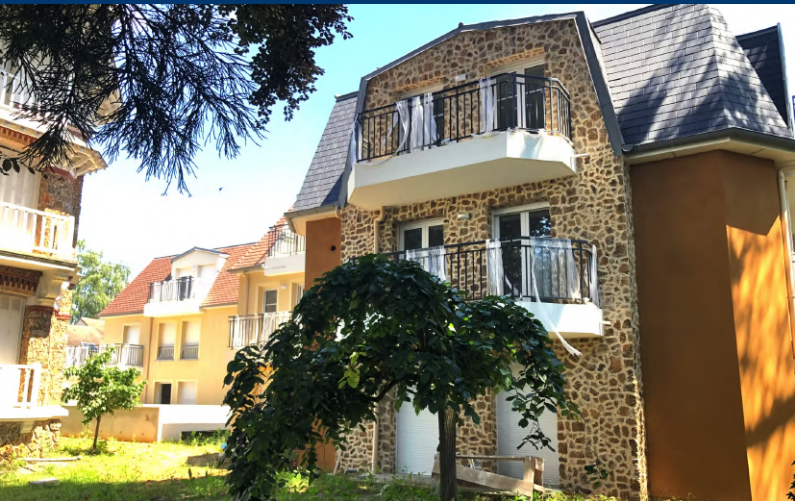
26 logements à Beaumont-sur-Oise Maîtrise d'ouvrage : FourStones 2 358 000 € HT 1488 m 2 SDP