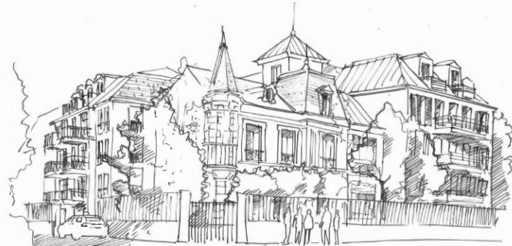
Dessin issu d'un ensemble de recherches présentées en Mairie du Plessis-Robinson Pour montrer l'intégration du projet autour du bâti existant.

Notre réseau de confiance développé avec les maires et les acteurs du bassin parisien nous donne une compréhension des problématiques locales ce qui offre aux promoteurs l'assurance d'un permis de construire obtenu et la garantie d'une collaboration harmonieuse avec les équipes des mairies tout au long du processus de réalisation du projet.