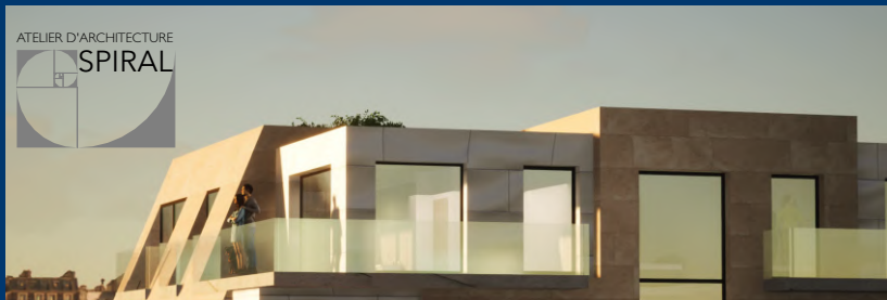
Projet en étude à Paris - 2023